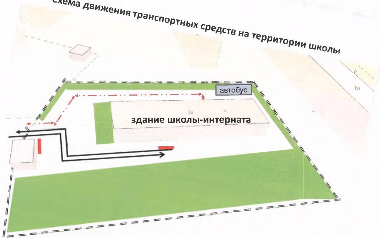
Схема движения транспортных средств на территории школы